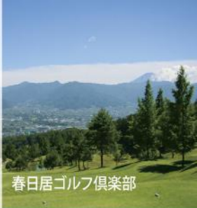
春日居ゴルフ倶楽部