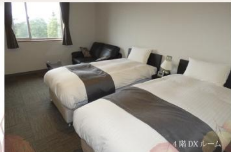
4階 DX ルーム