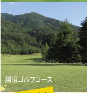
勝沼ゴルフコース