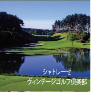
シャトレゼ ヴィンテージゴルフ倶楽部