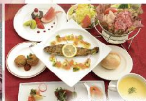
洋風御膳レギュラー