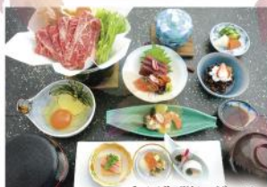
和風御膳レギュラー