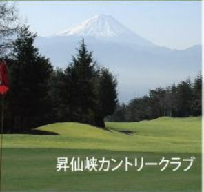
昇仙峡カントリークラブ