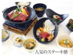
人気のステーキ膳