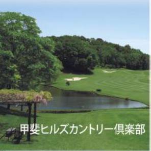
甲斐ヒルズカントリー倶楽部